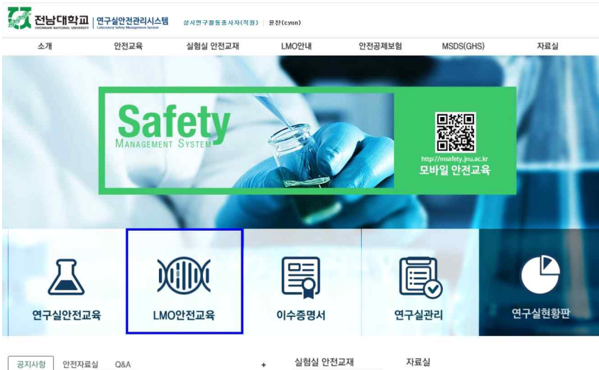
[그림4 메인 홈페이지]