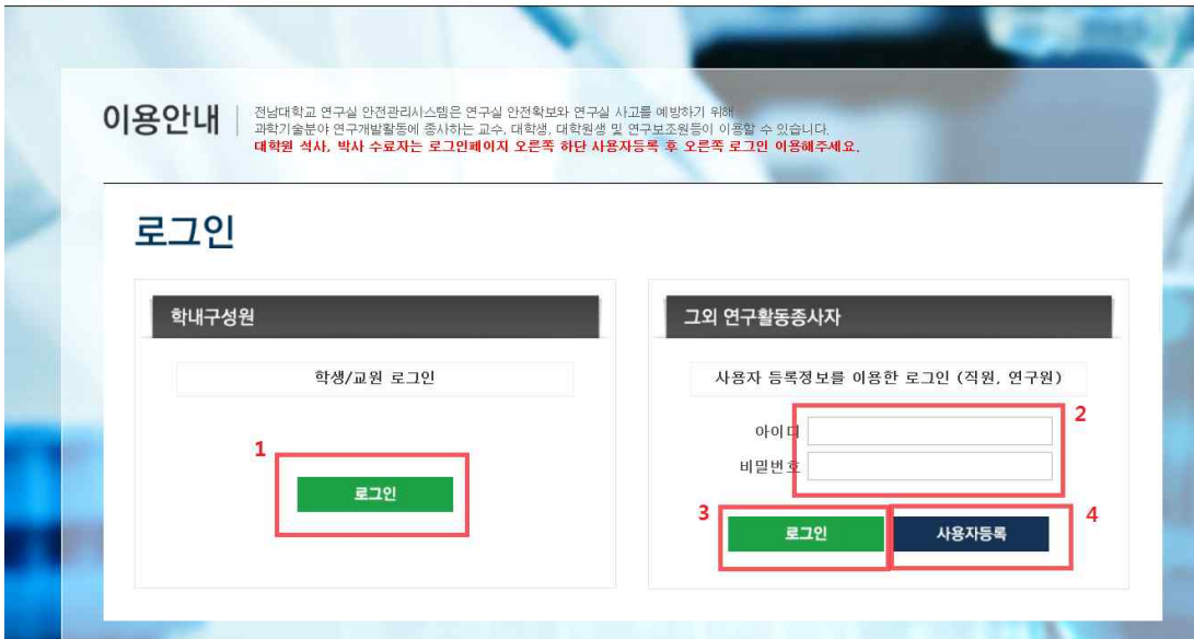
[그림2 로그인 화면]