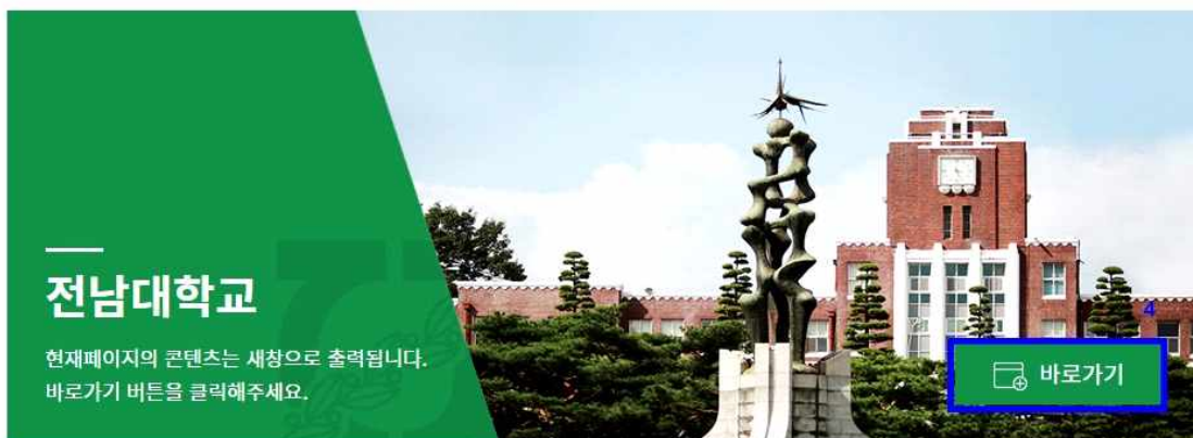
[그림1] 전남대학교 홈페이지 화면